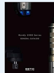
Handy 2000 Series GENERAL CATALOG